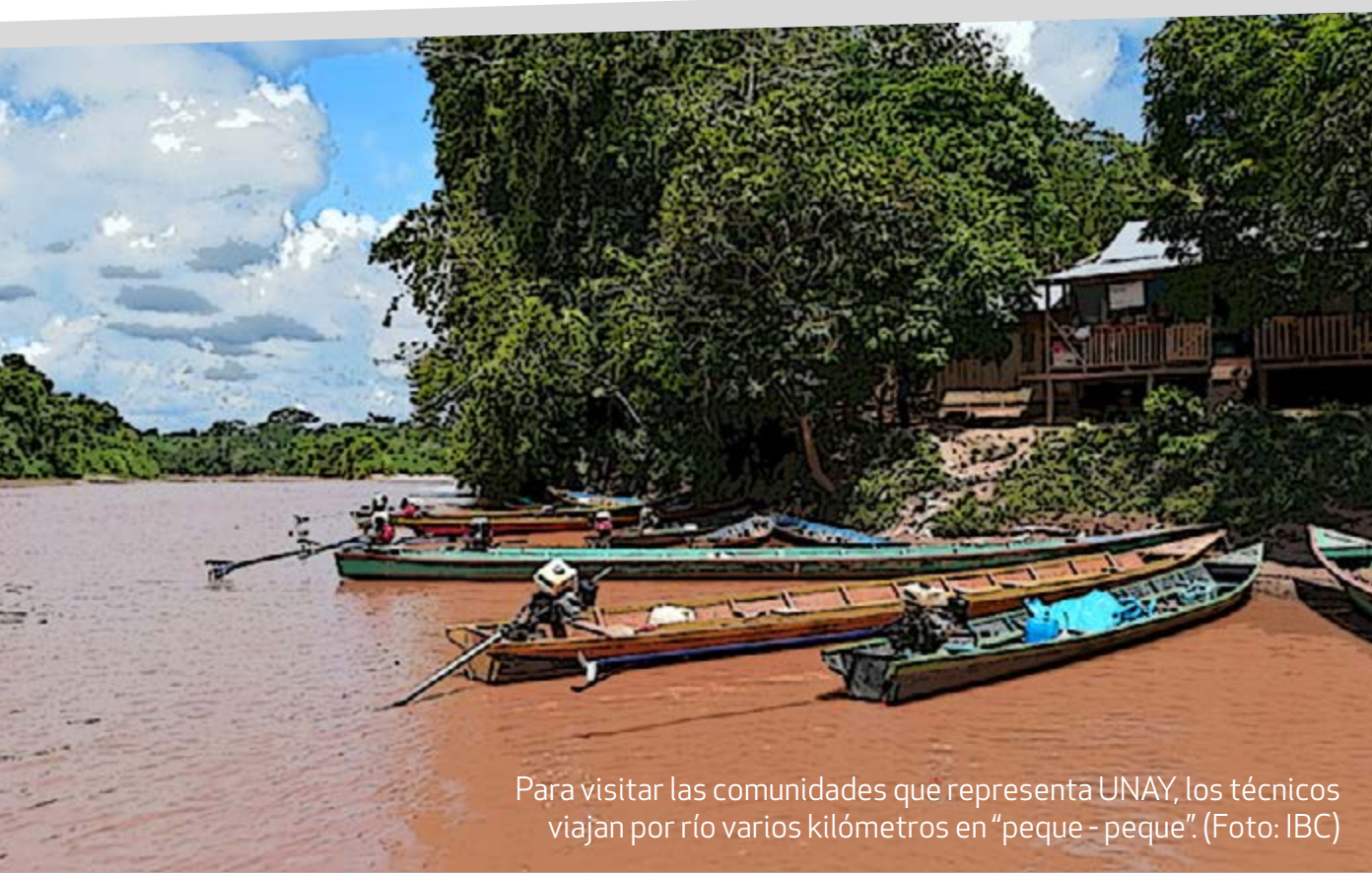
Para visitar las comunidades que representa UNAY, los técnicos viajan por río varios kilómetros en "peque-peque".

En él priorizaron reavivar sus prácticas de medicina tradicional para prestar un servicio de salud culturalmente pertinente que empodere a las comunidades a fortalecer su autonomía y (re)vincule a los jóvenes con la cultura tradicional.