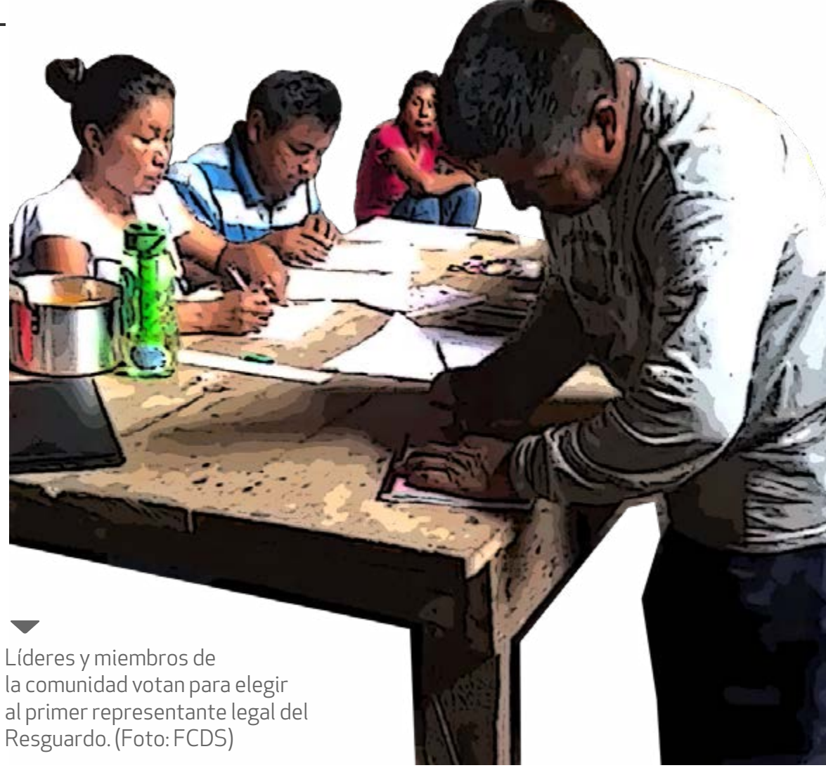
Líderes y miembros de la comunidad votan para elegir al primer representante legal del Resguardo.