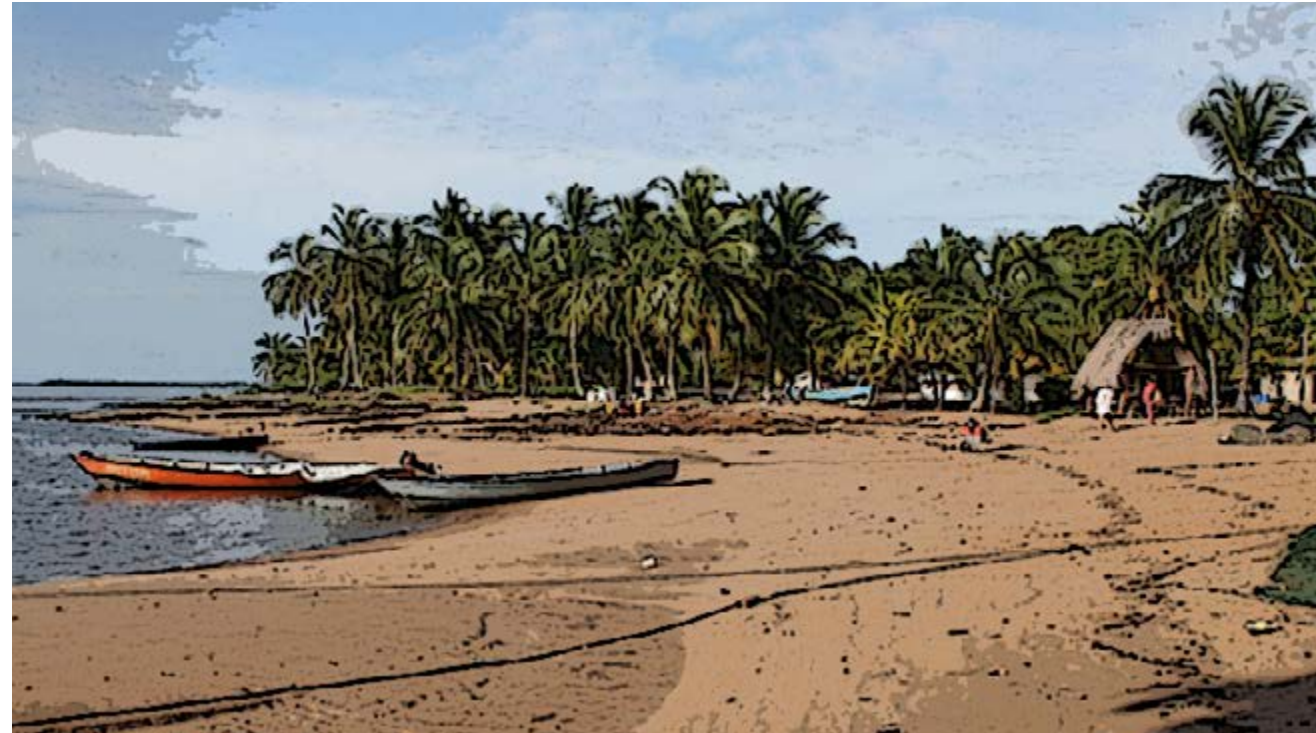
Galibi es un área tribal habitada por una población indígena de amerindios de Kalina. Sus playas son conocidas mundialmente como sitios de anidación de cuatro especies de tortugas marinas gigantes que se encuentran en peligro de extinción. El crecimiento en la población de Galibi incrementa la cantidad de residuos, y el servicio de recolección de residuos del gobierno no llega aquí.

Con este proyecto, buscan fortalecer, en la práctica, sus capacidades administrativas y financieras en el diseño, documentación e implementación de proyectos sostenibles.