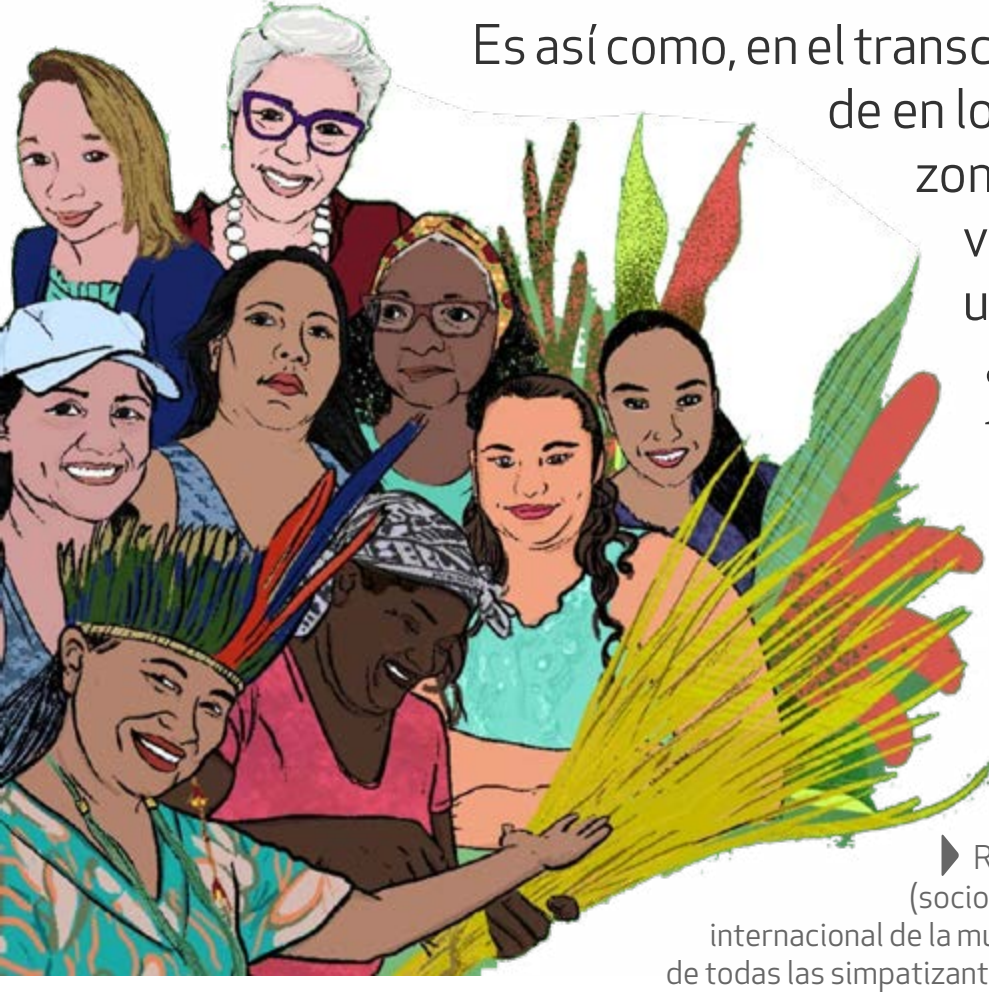
Retrato de mujeres que trabajan con el IEB (socio de SCIOA en Brasil) para celebrar, en el día internacional de la mujer, los logros de los derechos y las victorias de todas las simpatizantes de Buen Vivir. (Ilustración: © Miguel Haru)

Es así como, en el transcurso de este año, miembros de los nueve estados de la Amazonía brasileña, se han reunido virtualmente para elaborar un proyecto ante posibles aliados, con el fin de construir una estrategia de lucha contra la violencia hacia las mujeres indígenas.